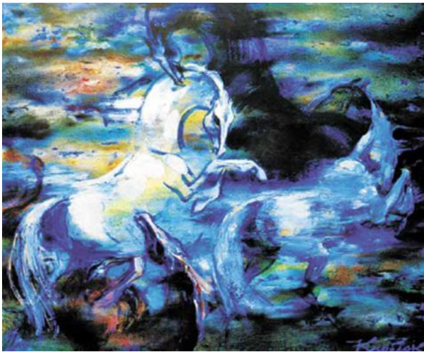
Andrej Knoblok «Pferde»