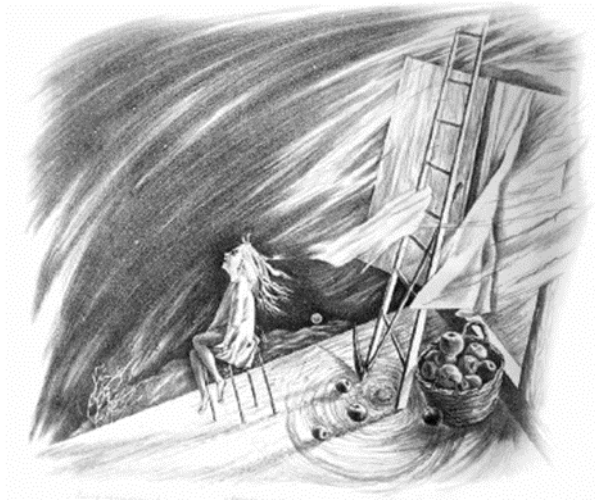
Natalia Bakanowa «Der Räumenwind»