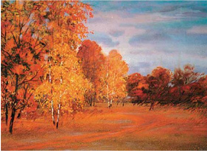
Jurij Günthner „Der Altweibersommer“