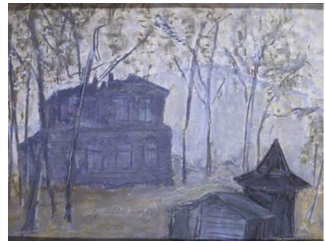
Swjatoslaw Richter, Pianist

9) Wer war der Autor des offiziellen Themas zu den Sendungen der FIFA Fußball-Weltmeisterschaft 2018? Die Komposition heißt „Where Angels Fear to Tread - FOX Sports Original Soundtrack“.